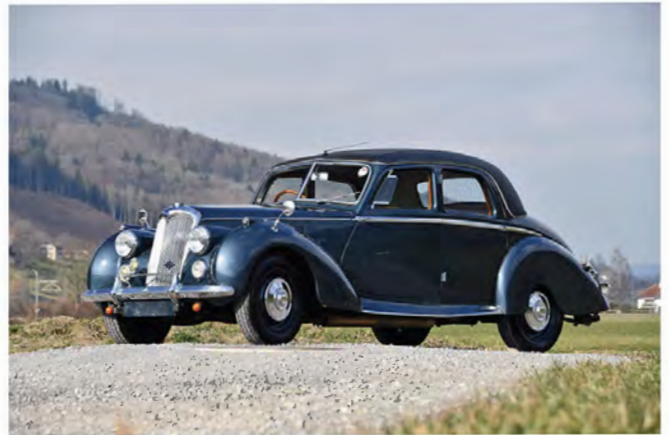
Riley RME Saloon 1.5 (1954) Auktion Toffen 25.3.23, CHF 8'960.00