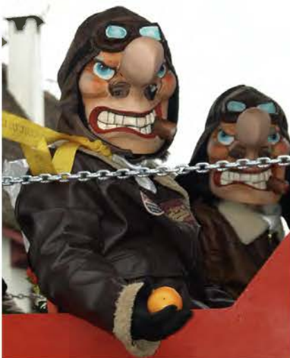
Basler Fasnacht 2023

Ich freue mich, möglichst viele von Euch in Toffen begrüßen zu dürfen. Erfreulicherweise dürfen wir auch wieder vier Kandidaten neu aufnehmen. Leider waren meine Bemühungen, die beiden nachfolgend abgebildeten Herren zu einem Beitritt zu bewegen, erfolglos. Immerhin hat es eine Orange gegeben.