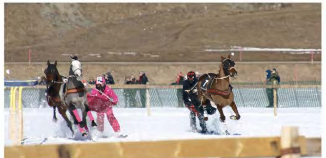
Skijöring: Powerslide mit einem PS..... (Man beachte den fehlenden Schnee im Hintergrund)

Der Zufall wollte es, dass eine am Ende meiner Skiferien-Woche etwas verrückte Veranstaltung auf dem zugefrorenen St. Moritzer-See stattfand. Dort, wo bis vor kurzem lediglich 1-PS'ler über die Schnee- und Eisdecke galoppierten, traf man nun auf eine Anzahl auserlesener Gentlemen-Driver, die mit ihren hochkarätigen Preziosen auf der Rennpiste dem Powerslide frönten. I.C.E. steht einerseits für «International Concours of Elegance» und auch für das englische Wort für «Eis». Damit wird der Bezug zum Ort des Geschehens, nämlich dem zugefrorenen See hergestellt.