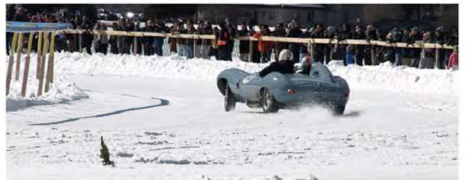
.....und auch mit vielen

Die Teilnehmer setzen sich vor allem aus privaten Besitzern und Sammlern zusammen, die von den Organisatoren (dieses Jahr bereits zum vierten Mal) eingeladen werden. Mittlerweile haben auch Marken, wie Ferrari, Lamborghini, Mercedes Classic oder Maserati die Veranstaltung für sich entdeckt und präsentieren ihre Museums-Exponate. Um überhaupt Aufnahme ins Teilnehmerfeld zu finden, muss man schon über ein sehr exklusives, fast einmaliges Fahrzeug verfügen, welches darüber hinaus eine sehr interessante Geschichte aufweisen sollte.