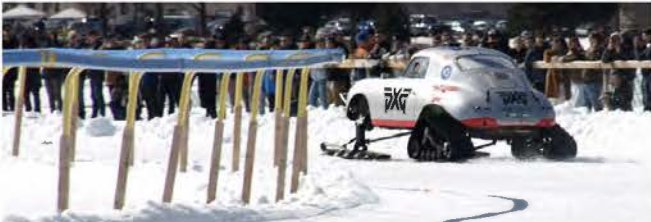
Porsche 356 perfekt vorbereitet für den I.C.E.- RUN