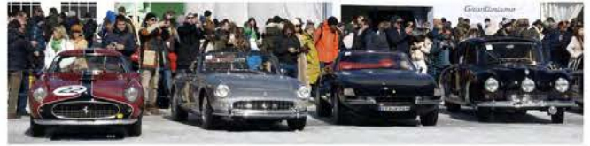
Ferraris: 250 GTB Berlinetta «Tour de France», 275 GTS Spider, Daytona Spyder und ein Tatra 87