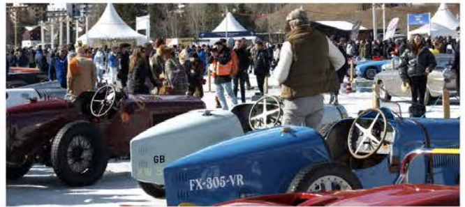
Pre War Trio (Alfa der Scuderia Ferrari und zwei Bugattis)