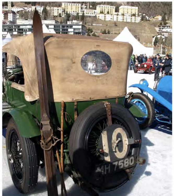
Skis für alle Fälle!