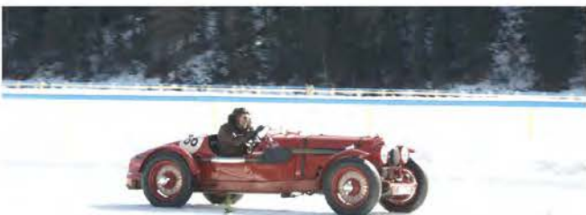
Aston Martin Ulster «Speed on the rocks»