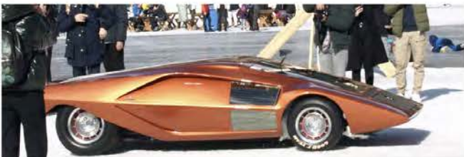
Lancia Stratos HF Zero Concept Car by Bertone