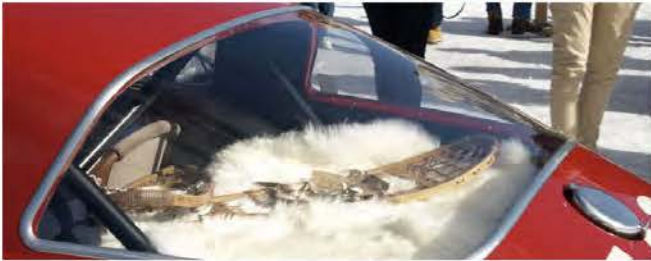
Die Schneeschuhe dürfen nicht fehlen