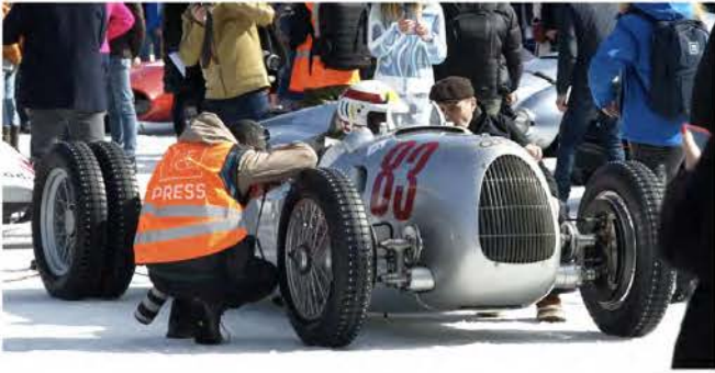
Auto Union Silberpfeil mit Doppelbereifung und Spikes