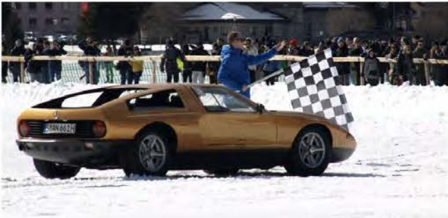
Mercedes C111 Concept-Car (einziges fahrtaugliches Exemplar)