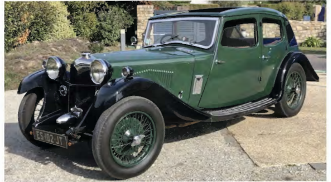
Riley Kestrel 12/6, Euro 35'000, Car&Classic-Auktion im Internet