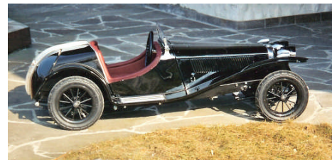
Riley MPH Piccolo by Albiez

Sehr gut ist auch die Teilnahme an der anschließenden „Lake of Constance – Tour“, welche vom 31. August bis 3. September 2009 stattfinden wird. Vom Standort Parkhotel St. Leonhard in Überlingen (D) werden wir gemeinsame Ausfahrten mit Besichtigungen der Insel Mainau, von Meersburg, des Zeppelin-Museums u.v.A.m. unternehmen!