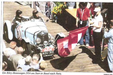
Ein Riley-Rennwagen 1934 am Start in Basel nach Paris.