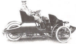
11 A complete 1907 Riley Nine Tricar. (R & R Scott).

Die RILEY - Fahrzeuge der Mitglieder sollen in Zukunft in einem separaten Register mit allen detaillierten Angaben, Bildern, Reg.Nr., Geschichte etc. geführt werden. Das „Werk“ ist im Vorstand in Arbeit und ein entsprechendes Fahrzeugblatt liegt hier bei. Wir möchten Euch bitten, diese möglichst „artengerecht“ zu beantworten. Das Register soll allen Mitgliedern zugänglich sein.