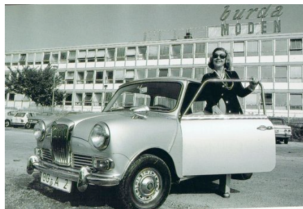
Aenne Burda mit ihrem „Bonsai Rolls Roice“

Nicht Alltägliches geschah im Februar dieses Jahres, als mich eine Dame aus Deutschland um Rat ersuchte. Im Zusammenhang mit dem 100. Geburtstag der vor vier Jahren verstorbenen Verlegerin Aenne Burda plant man in Offenburg eine Gedenkausstellung. Dabei stiess man auf dieses Foto und die Organisatoren machten sich auf die Suche nach dem Riley Elf.